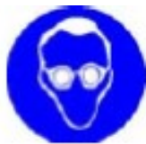
Jól záró védőszemüveg